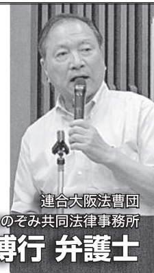
連合大阪法曹団 のぞみ共同法律事務所

有期労働契約から無期労働契約の転換は自動で転換されません! 本人からの会社への申し込みが必要です。 申し込みをする際は、形に残る書面での申し込みにしてください。