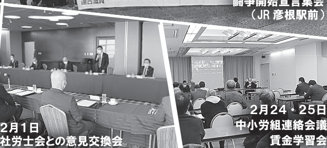
2月1日 社労士会との意見交換会