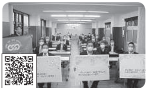
2021年2月26日 東日本大震災フォトメッセージ 10年前の記憶と教訓を風化させることなく、 防災・減災の活動につなげよう