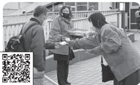
2021年3月8日 3.8国際女性デー (JR 草津駅前) 連合滋賀女性委員会にて 国際女性デーをPR