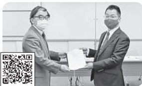
2021年3月8日 滋賀労働局への要請行動 雇用・労働対策の推進など 7項目に関して要請