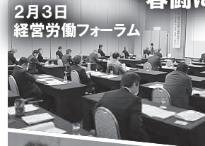
2月3日 経営労働フォーラム