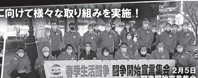
2月5日 春季生活闘争 闘争開始宣言集会 闘争開始宣言集会 (JR 彦根駅前)