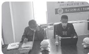
2021年2月22日～26日 全国一斉集中労働相談ホットライン 19件の相談が寄せられる 中日新聞に掲載されました