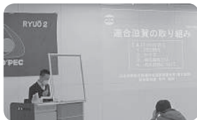
2021年2月7日 連合滋賀 出前講座 (初開催) ダイハツ労組竜2支部青年部研修会にて 連合滋賀の活動を紹介