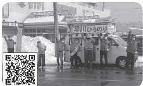
2021年1月24日～31日 高島市議会議員選挙 1,072票で早川ひろのり氏2期目の当選 (少数点以下切り捨て)