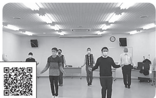
2021年4月26日～7月31日 目指せ1万回！縄跳びリレー 青年委員会でコロナ禍でもできる活動を企画し、11,500回(230名)を達成！