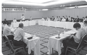
2021年9月15日 連合滋賀・地協代表者会議 地域協会の今後の活動のあり方について議論