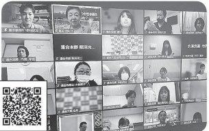
2021年9月4日 連合近畿ブロック女性リーダーセミナー 嘉田参議院議員が「政治への女性参画がなぜ必要なのか」講演。約70名が参加