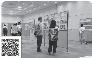
2021年7月30日～8月1日 連合近畿ブロック原爆展 戦争・核兵器の恐怖を風化させない... 滋賀会場1,630名が来場！