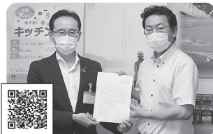
2021年8月4日 政策・制度要求12課題を滋賀県に提出 労働政策やコロナ対策、教育など組合員の声を届ける