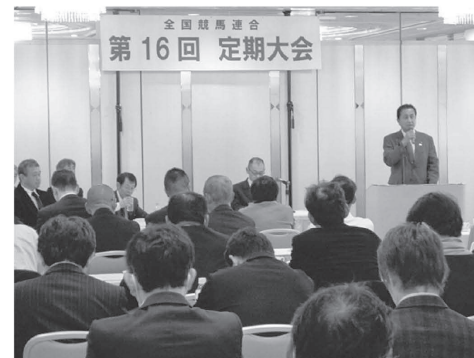
▲1-1 昨年の定期大会の様子 (昨年、本年は書面決議)

地方自治体や日本中央競馬会と厩舎労働者には雇用関係はなく、直接の雇用者は、馬主の預託料を経営の原資としている「調教師」と呼ばれる厩舎の経営者であり、一般的な企業と比較したら使用者団体が複数いる複雑な組織とも言えます。