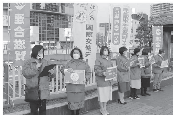
マイクリレーをする女性委員会と連合滋賀議員団

連合滋賀女性委員会が中心となり、JR草津駅前前で街頭マイクアピールを行いました。「国際女性デー」をきっかけに、固定的性別役割分担意識の払拭、意思決定の場への女性参画、あらゆる暴力・ハラスメントの根絶に向けて、今一度、職場環境の整備を進めていきましょう！