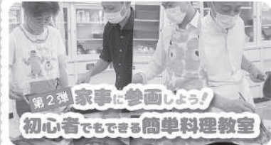
第2弾 家事に参画しよう！ 初心者でもできる簡単料理教室