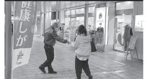
10月27日(木)JR石山駅にて