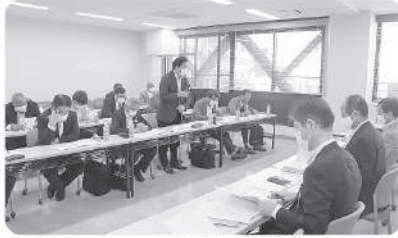
10月18日～20日：滋賀県との部局協議(10部局と)

加盟組織から意見集約した要望をまとめ、8月5日(金)に滋賀県に対し要求書の提出を行い、10月中旬の3日間で県の各部署と県の施策・取組に対し協議を行い、11月8日(火)に三日月大造滋賀県知事をはじめ県の各部長との総括協議を行いました。