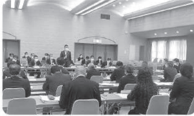
11月8日：滋賀県との総括協議