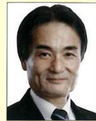
衆議院議員 徳永 久志