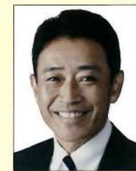
元衆議院議員 田島 一成