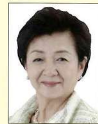
参議院議員/チームしが代表 かだ 由紀子