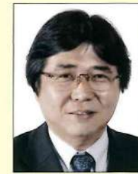
滋賀県議会議員 えばた 弥八郎