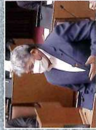
▲ 議会にて積極的な意見と提言