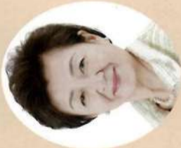
参議院議員 チームしが代表 嘉田由紀子