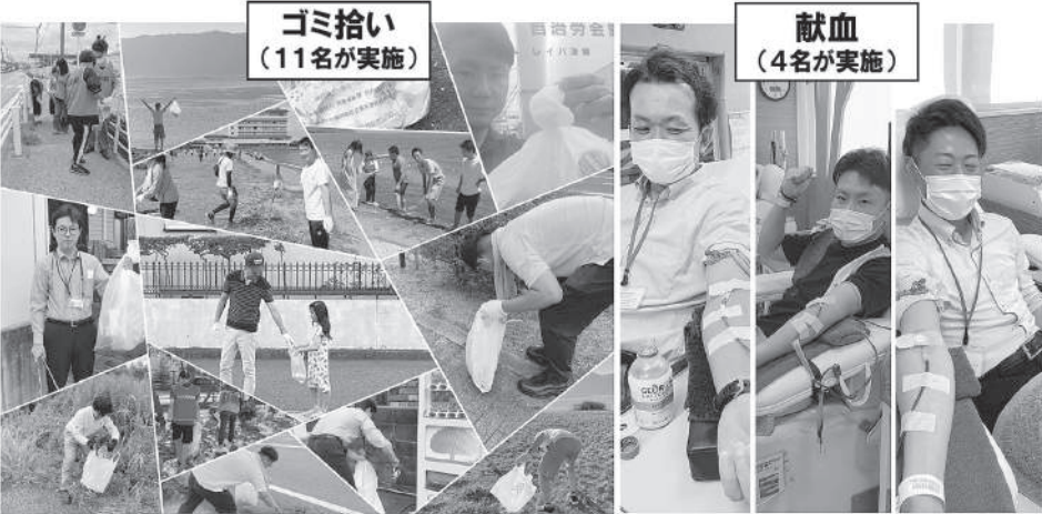
ゴミ拾い (11名が実施)

青年委員会の社会的課題への関心啓発の取り組みとして「自らができることから」をコンセプトに青年委員会三役・幹事にてゴミ拾い・献血活動に取り組みました！これを機に少しでも、滋賀県の美化活動や、病気の治療や手術などで輸血を必要としている患者さんの尊いいのちを救うための献血活動に取り組んでいただく方が増えたら幸いです。