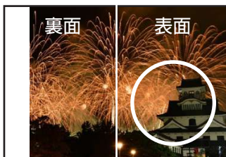
大会議案書への印刷例)

最優秀賞は 定期大会の議案書として、 使用するため 風景画像 (特に写真右側にインパクトがある写真) が選ばれやすいです。 ポイントを考慮した写真を応募 いただけると幸いです。